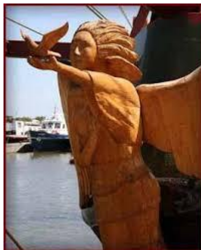
Boegbeeld van verandering

Het is aan de gemeenteraad om te bepalen hoeveel haast men met de verandering wil maken. Wil men tot maart 2020 wachten of zou een waarnemer als boegbeeld van verandering al eerder aan de slag moeten?